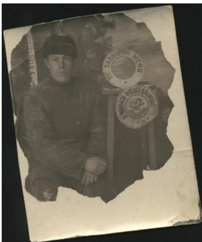
Фотография, отправленная на память другу(фото 3)