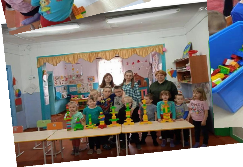
Весна 2022, в Тальском детском саду